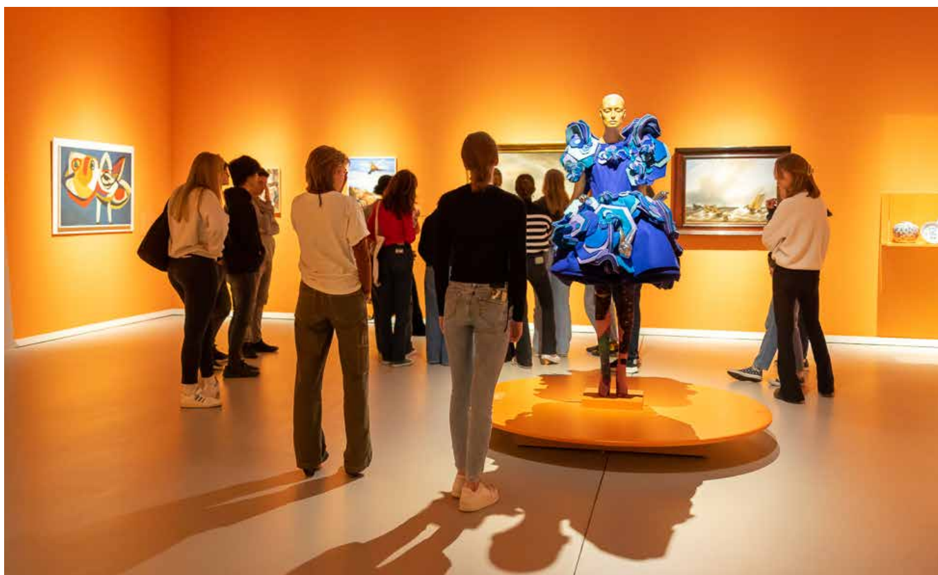
Jeugd dompelt zich onder in kunst in het Groninger museum

Goed cultuuronderwijs vergt een lange adem en commitment van alle betrokken stakeholders. Landelijk is daarom het bestuurlijk kader Cultuur en Onderwijs 1 vastgesteld, waarin wordt aangestuurd op lokale overeenkomsten Cultuur en Onderwijs. Daarop voortbordurend hebben we een eigen regionale vertaling gemaakt, waarbij we onze inspanningen voor een langere periode vastleggen. We doen dit als overheden om onze commitment naar elkaar uit te spreken. Bij de verdere uitwerking en de uitvoering hiervan betrekken we nadrukkelijk het culturele en onderwijsveld. Binnen de Groningse situatie verbreden we onze blik naar het buitenschools cultuuraanbod. Mede door de ontwikkeling van verrijkte schooldagen (zoals Tijd voor Toekomst en School en Omgeving) en met oog op het Akkoord Cultuurbeoefening 2029 is het een logische stap om te denken vanuit samenhang tussen school en de culturele omgeving.